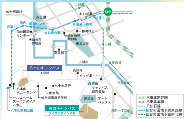
●八木山キャンパス

[東北工業大学 八木山キャンパス 132 教室] 〒982-8577 仙台市太白区八木山香澄町 35 番 1 号 ※地下鉄八木山動物公園駅から徒歩 10 分 シャトルバス運行・路線バスあり・学内駐車場あり